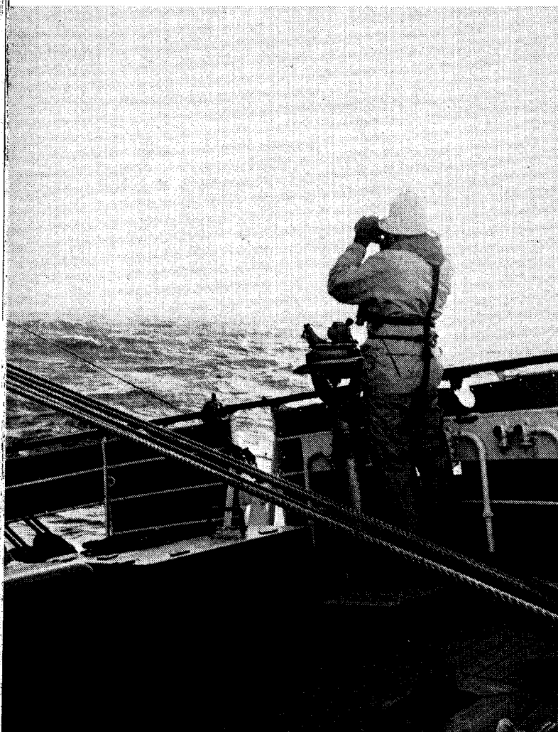
Abb. 2: Posten Rettungsboje