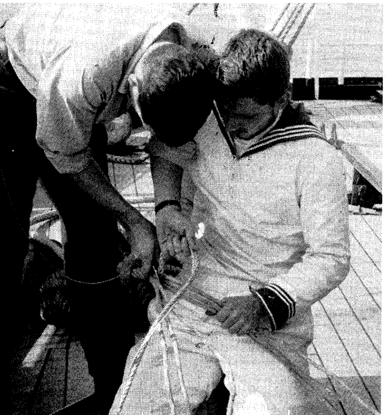
Abb. 3: Spleißen

geben sich zwei Aspekte. Zunächst geht es um die Seemännische Grundausbildung, ihren Inhalt und ihre Ziele. Der zweite Aspekt leitet sich aus der Tatsache ab, daß die Seemännische Grundausbildung während einer Auslandsreise auf einem Segelschulschiff durchgeführt wird.